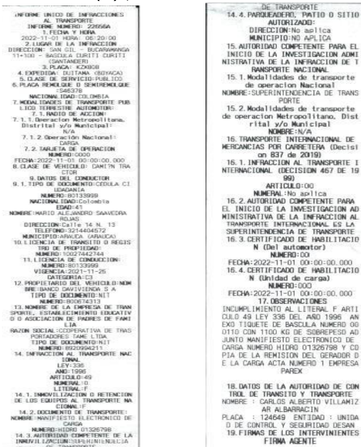
Imagen 1. Informe Único de Infracciones al Transporte No. 22656A del 01/11/2022

En este orden de ideas, el agente de tránsito describió en la casilla 17 de observaciones del precitado IUIT que "(...) Anexo ticket de bascula numero 000110 con 1100 kg de sobrepeso adjunto manifiesto electrónico de carga número Hidro 01326798 (...)", como se evidencia a continuación: