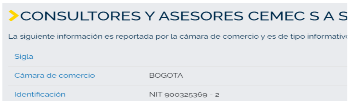
Imagen No. 1. https://www.rues.org.co/Expediente

Que este Despacho, al efectuar un completo análisis de dicho Informe observó que no se logra identificar el presunto sujeto infractor a las normas del sector transporte, toda vez que, en la casilla No. 11 -NOMBRE DE LA EMPRESA DE TRANSPORTE, ESTABLECIMIENTO EDUCATIVO O ASOCIACIÓN DE PADRES DE FAMILIA (Razón social) Y NIT- , toda vez que la información que el agente de tránsito registró no es legible y el número del NIT no es concordante con el nombre de la empresa, como se muestra a continuación: